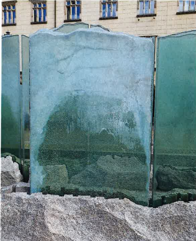
SZYBA NR 4