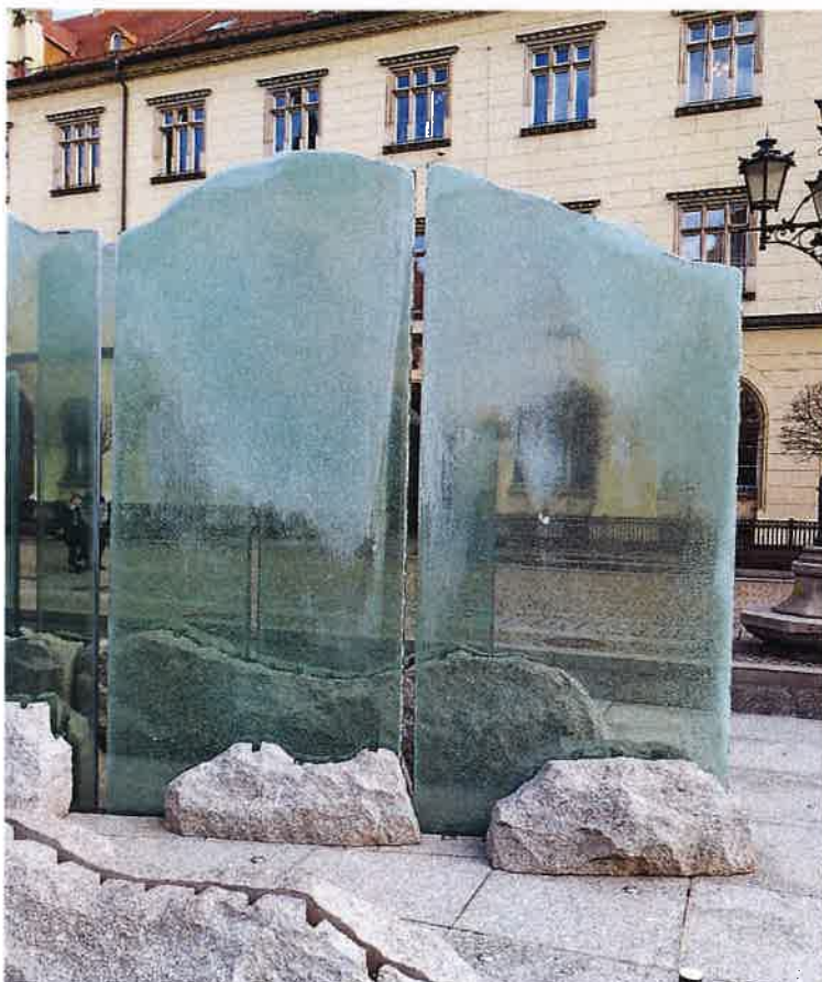
SZYBA NR 2 , 3