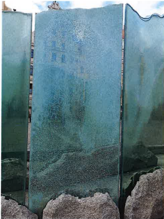
SZYBA NR 1