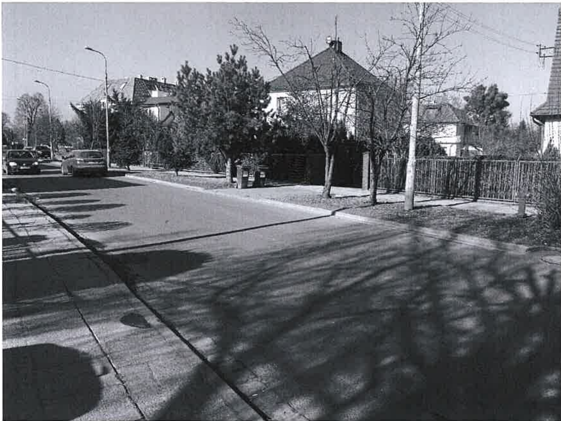
Rys. 1. Lokalizacja projektowanego progu