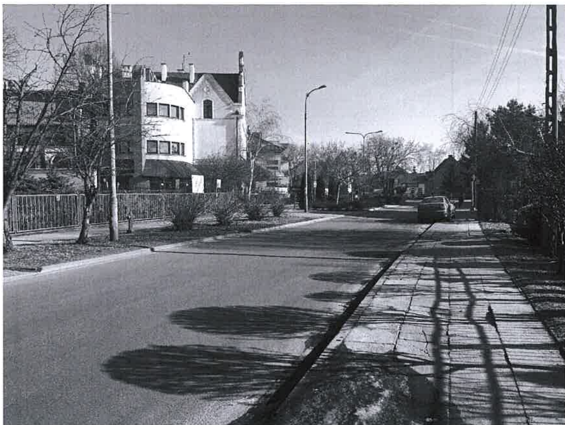
Rys. 2. Lokalizacja projektowanego progu