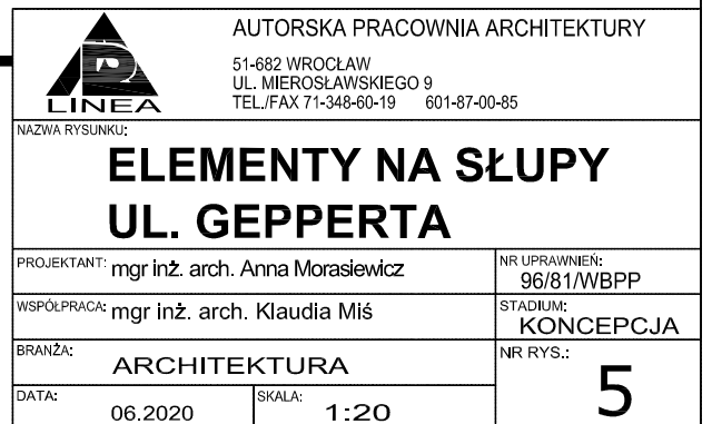
WIDOK OD CZOŁA LATARNI SKALA 1:20