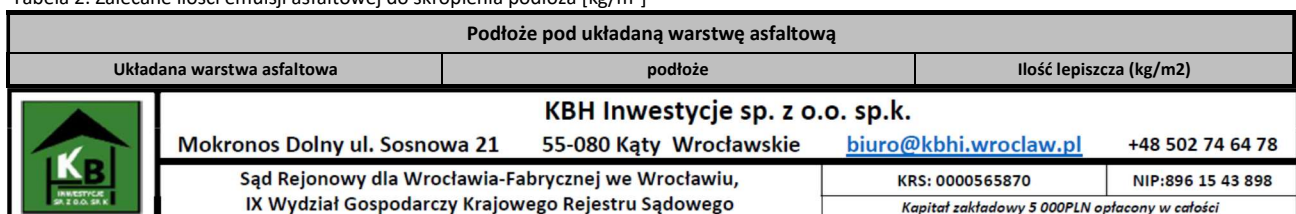
Tabela 2. Zalecane ilości emulsji asfaltowej do skropienia podłoża [kg/m 2 ]

Skropienie lepiszczem powinno być wykonane w ilości podanej w przeliczeniu na pozostałe lepiszcze podane w tablicy 2 (uściślenie w oparciu o tablicę 4 WT-2 cz.2 2016 )